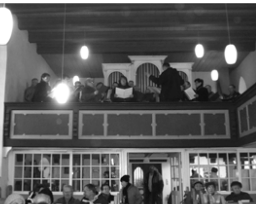
Kirchen- und Männerchor in Ragösen